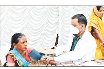
स्वास्थ्य परीक्षण करते चिकित्सक।

वेदांता समूह की कंपनी भारत एल्यूमिनियम कंपनी लिमिटेड ने विश्व स्वास्थ्य दिवस के अवसर पर वर्ष 2025 में अपनी सामुदायिक स्वास्थ्य परियोजना आरोग्य के माध्यम से लगभग 1.2 लाख लोगों को स्वास्थ्य सेवाओं का लाभ पहुंचाया। उच्च गुणवत्तापूर्ण एवं सुलभ स्वास्थ्य सेवाओं के माध्यम से बालको निरंतर समुदाय की सेवा कर रहा है। इस वर्ष की थीम मेरा स्वास्थ्य, मेरा अधिकार को आत्मसात करते हुए कंपनी ने निवारक स्वास्थ्य देखभाल को बढ़ावा देने की दिशा में महत्वपूर्ण योगदान दिया है। आरोग्य परियोजना के अंतर्गत वर्ष भर में 77 हजार 700 से अधिक लोगों को प्राथमिक, निवारक एवं उपचारात्मक स्वास्थ्य सेवाएं प्रदान की गईं। इसके अतिरिक्त, तीन ग्रामीण स्वास्थ्य केंद्रों के माध्यम से 3400 से अधिक नागरिकों को नियमित प्राथमिक उपचार एवं चिकित्सकीय परामर्श उपलब्ध कराया गया। साथ ही, बालको द्वारा संचालित दो मोबाइल