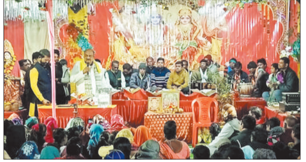
कथा में उपस्थित पूर्व राजस्व मंत्री व श्रद्धालुगण।