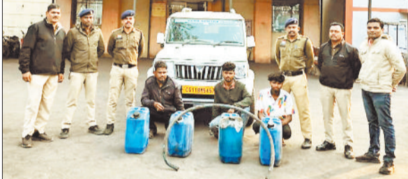
पुलिस गिरफ्तार में आरोपी व जब्त डीजल व बोलेरो वाहन।

गेवरा खदान में घुसकर डीजल चोरी कर भाग रहे डीजल चोरों को जब सीआईएसएफ की टीम ने रोकने का प्रयास किया था तो डीजल चोरों ने सीआईएसएफ के चार पहिया वाहन को ठोकर मारकर फरार हो गए थे और उन पर हमला करने का प्रयास भी किया था। मामले में पुलिस तत्काल एक्शन मोड में आई और गंभीर धाराओं के तहत अपराधियों के खिलाफ अपराध पंजीकृत किया था और फरार अन्य आरोपियों की सरगर्मी से खोजबीन की जा रही थी। पुलिस ने बुधवार को फरार तीनों आरोपियों को गिरफ्तार कर सलाखों के पीछे भेज दिया है। जबकि मामले