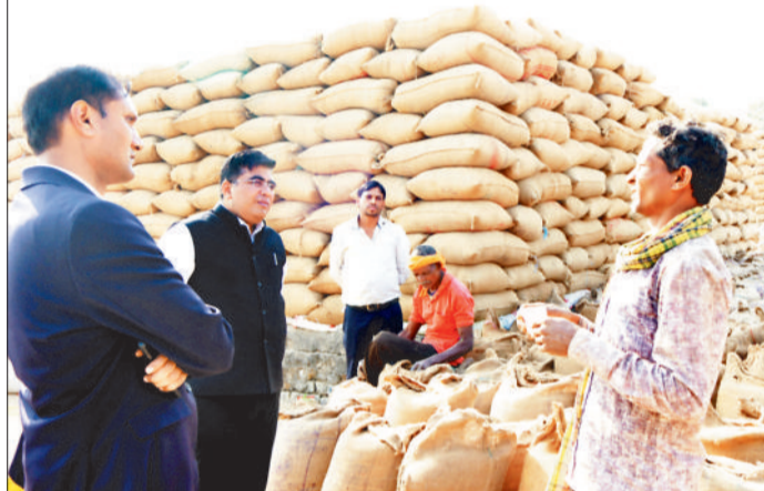
निरीक्षण के दौरान किसान से जानकारी लेते कलेक्टर।

कलेक्टर कुणाल दुदावत ने खरीफ विपणन वर्ष 2025-26 के अंतर्गत समर्थन मूल्य पर धान खरीदी की व्यवस्था का जायजा लेते हुए कोरबा एवं करतला विकासखंड के विभिन्न उपार्जन केंद्रों का निरीक्षण किया। कलेक्टर ने स्पष्ट निर्देश दिए कि उपार्जन केंद्रों में वास्तविक किसानों से धान की खरीदी सुनिश्चित की जाए। उन्होंने समितियों को निर्देशित किया कि केंद्रों में आने वाले धान को अनिवार्य रूप से पलटी कराकर ढेरी लगाई जाए, नमी की जांच तथा पुराने एवं अमानक स्तर के धान की खरीदी पर पूर्णतः रोक लगाई जाए।