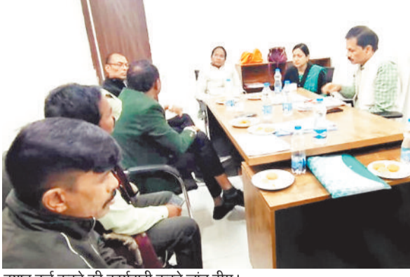
बयान दर्ज करने की कार्यवाही करते जांच टीम।

■ खदान से अप्रत्यक्ष रूप से प्रभावित क्षेत्रों में अधिक काम स्वीकृत करने का आरोप