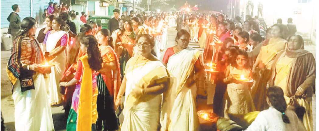
कोरबा। मकर संक्रांति के अवसर भगवान अर्युणा स्वामी की शोभायात्रा सीतामणी से निकाली गई। जो शहर के मुख्यमार्ग का भ्रमण करते हुए एसईसीएल अर्युणा मंदिर में पहुंचकर समाप्त हुई। इस अवसर पर मंदिर परिसर में धार्मिक कार्यक्रम आयोजित किया गया।