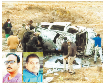
घटना के बाद ईको वाहन में लगी आग। जांच पड़ताल करती पुलिस व इनसेट में मृतक।

फीट गहरी खाई में जा गिरी। हादसे के होते ही एक वाहन में आग लग गई। वाहन में सवार दोनों युवक जलकर खाक हो गए। हादसे की सूचना मिलने पर पुलिस की टीम व दमकल