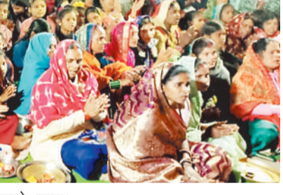
नवधा रामायण का श्रवण करते श्रद्धालु।