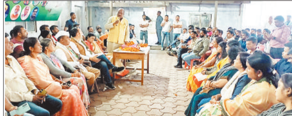
कार्यकर्ताओं को संबोधित करते पूर्व राजस्व मंत्री।