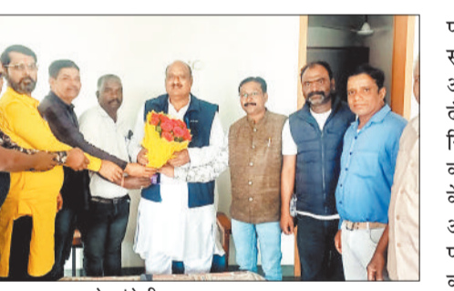
पूर्व मंत्री से मुलाकात करते कांग्रेसी।