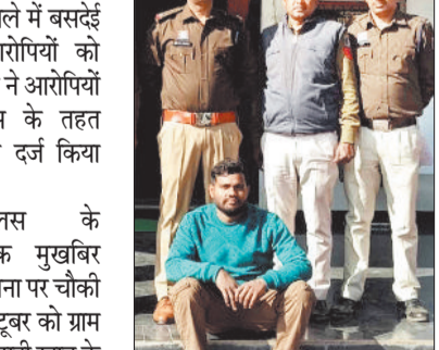
पुलिस गिरफ्तार में आरोपी।